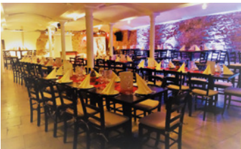
DER GEWÖLBKELLER – PALÜ-KELLER