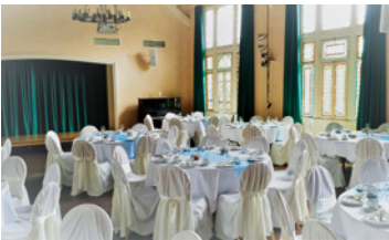
DER JUGENDSTILSAAL – PALÜ-SAAL

Events wie Weihnachtsfeiern, Mitarbeiterfeste, Jubiläumsfeiern, Kundenevents, Tagungen oder Seminare angepasst und umgesetzt. Ein professionelles und freundliches Team freut sich darauf, Sie schon bald begrüßen zu dürfen!